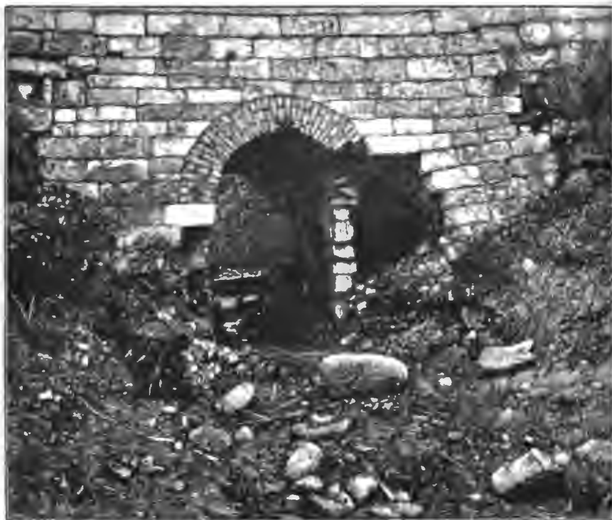
Стѣна въ Смоленскѣ до восстановления [Литвицкій ручей].