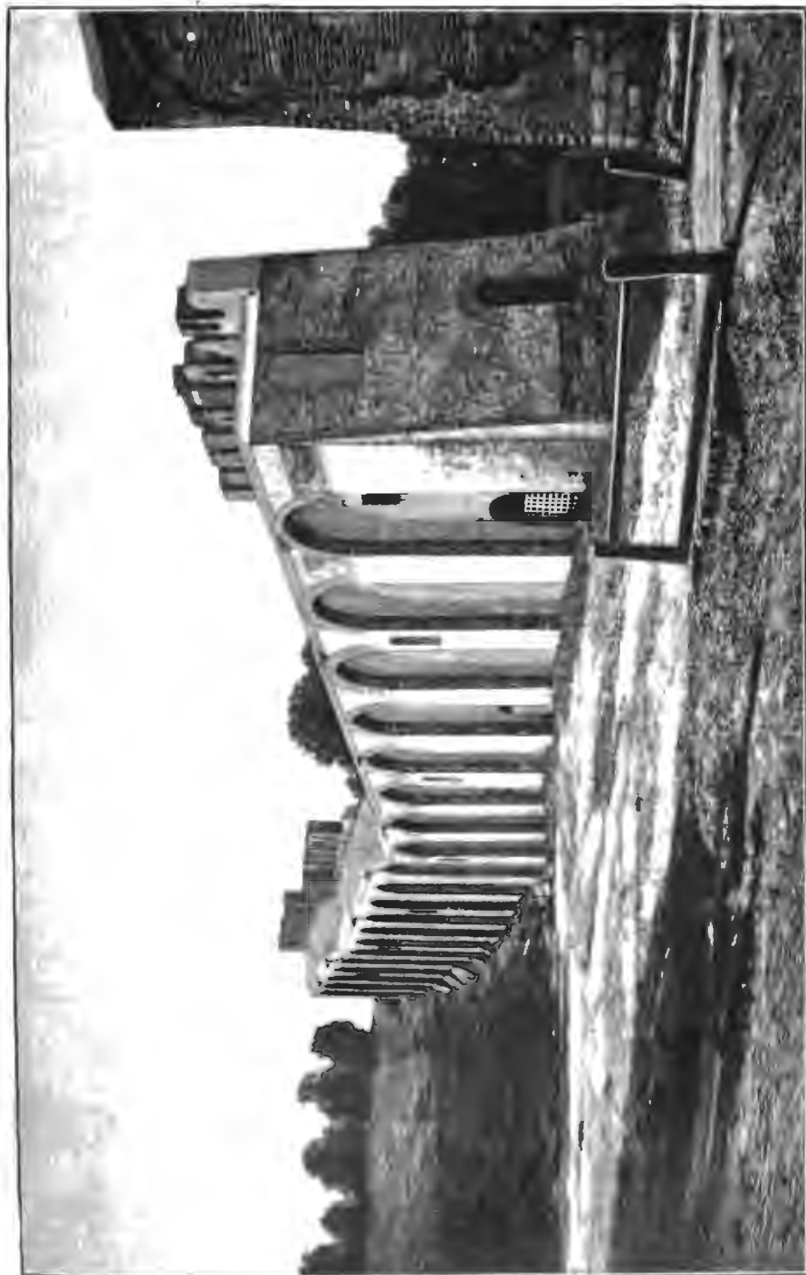
Стѣна въ Смоленскѣ по возобновленіи.